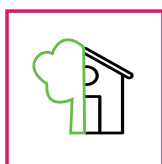
Outdoor / Indoor